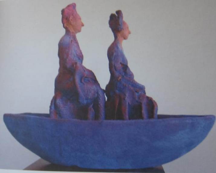
Bente Kluge, Kryj i królowa , 2018, ceramika malowana, wypal w 900°C, 30 x 40 cm, wf. artystki

Artystka pokazała mi zawartość komórki, która skrywa prace wielkogabarytowe, bardzo ciekawe. Część obiektów jest jeszcze nieukończona lub „po przejściach”. Bardzo chciałam wybrać coś do mojej kolekcji, ale nie udało mi się to za tym pierwszym razem. Wcześniej słyszałam o świetnych starszych pracach rzeźbiarki, które miały przedstawiać łodzie wikingów, wszystko w stonowanej kolorystyce.