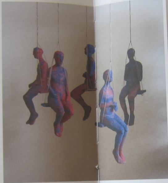
Bente Kluge, Huśtawka , 2019, ceramika malowana, wypał w 900°C, 40 cm, wł. artystki

Najwięcej z nich ukazuje konie z jeźdźcami; są z nieszkliwionej gliny, wypalone w temperaturze 950 stopni, malowane na zimno akrylami w ostrych kolorach. Zobaczyłam je na następnym spotkaniu w pracowni Bente w Sopocie. Artystka nazywa je łódkami. Są bardzo intrygujące, zwłaszcza te odlane z brązu. W bliskim kontakcie stały trzy łódki, ale wykonane z surowej gliny. Jedna angobowana. Jednak kolejny raz nic nie wyniosłam z tej pracowni. Długo rozmawialiśmy, a nie ukrywam, że chciałam pozyskać do mojej kolekcji najbardziej charakterystyczne prace tej rzeźbiarki. Teraz wiem, że moje trzecie spotkanie zakończy się sukcesem, czyli do trzech razy Sztuka!