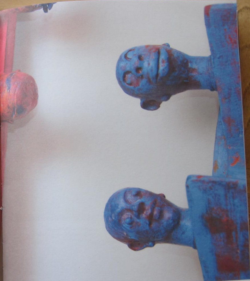
Bente Kluge, No past, no memoris , tryptyk, 2019, malowane drewno i woskowana ceramika, 150 × 50 × 20 cm, 170 × 50 × 20 cm, 200 × 50 × 20 cm, wf. artystki