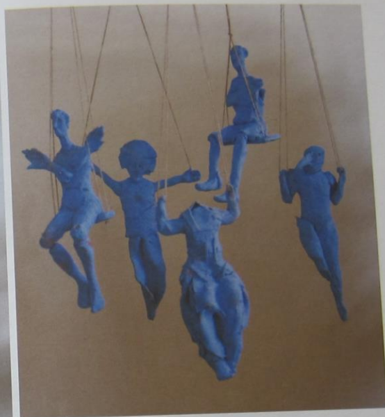
Bente Kluge, Huśtawka , 2019, ceramika malowana, wypał w 900°C, 30 cm, wł. artystki